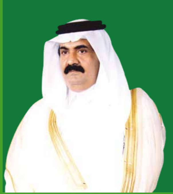
حضرة صاحب السمو الشيخ حمد بن خليفة آل ثاني أمير البلاد المفدى