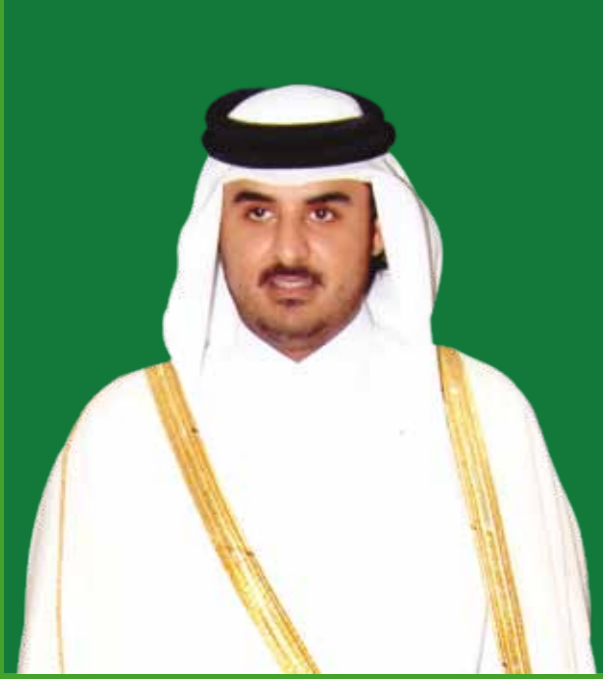
لسمو الشيخ تميم بن حمد آل ثاني ولي العهد الأمين