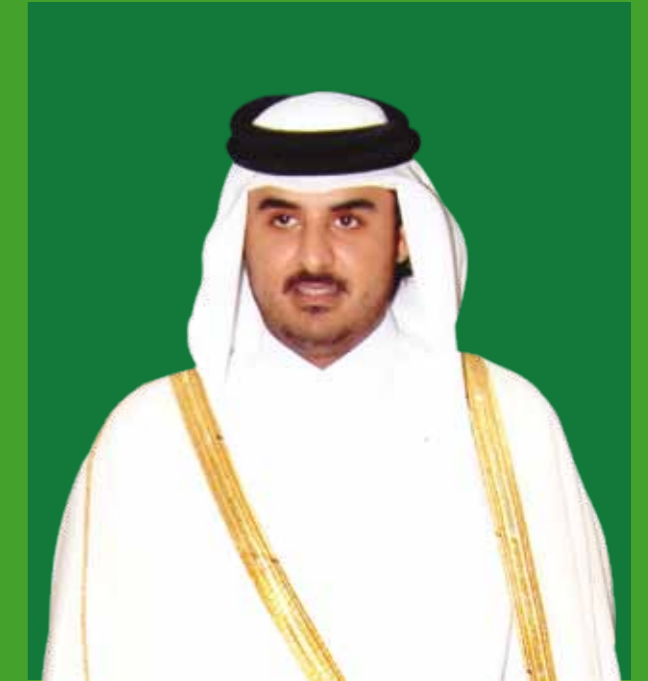
His Highness SHEIKH TAMIM BIN HAMAD AL THANI The Heir Apparent