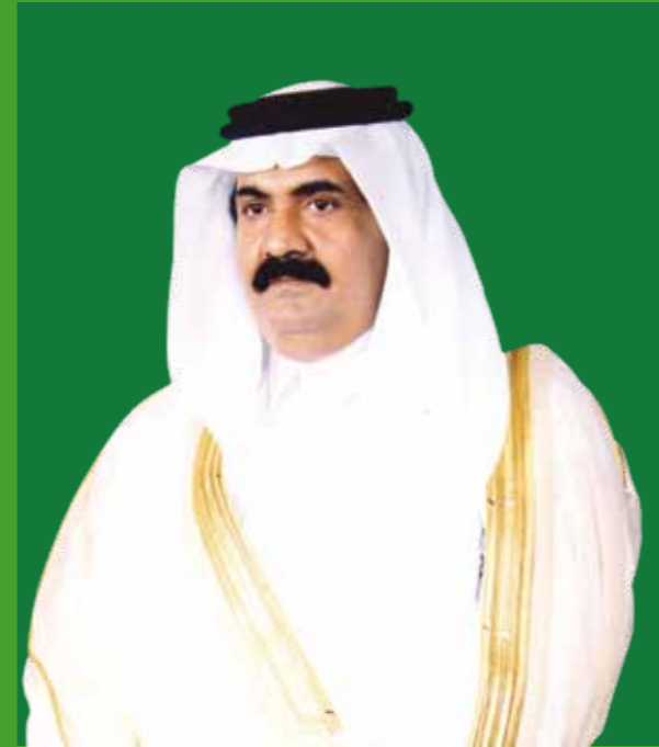
His Highness SHEIKH HAMAD BIN KHALIFA AL THANI The Emir of the State of Qatar

IN THE NAME OF ALLAH THE MOST MERCIFUL THE MOST COMPASSIONATE